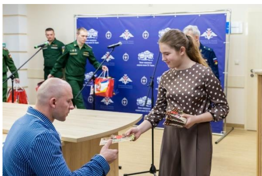
Рисунок 4. Выезд воспитанниц Пансиона в военно-медицинский госпиталь

В своей работе педагогический коллектив, и классные руководители, в частности, подчеркивают значимость гражданских ценностей. Педагоги организуют волонтерскую деятельность, направленную на помощь ветеранам, военнослужащим, находящимся на лечении детям. Данные инициативы способствуют воспитанию гуманизма, социальной ответственности и готовности к служению обществу [рисунок 4].