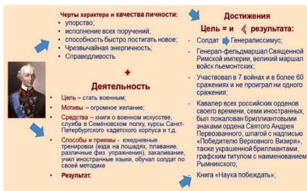
Результат работы по схеме при изучении личности Александра Васильевича Суворова

Работа по данной схеме может предполагать 2 варианта изучения личности.