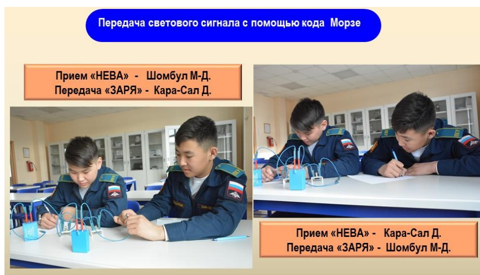
Фото 5. Изучение кодов азбуки Морзе с помощью светового сигнала.

Следует отметить, по окончании участия в пробе важно вовлечь обучающихся в процесс рефлексии приобретенного опыта (индивидуально или в группе). Наш опыт показывает, полученные знания и навыки на занятиях с применением профессиональных проб, кадеты реализуют в своих проектах. Пример тому, проекты кадет выпускников 2021 года Кызылского ПКУ, которые имели успех, такие как, «Создание телеграфного ключа для изучения азбуки Морзе», «Применение электромагнита в использовании телеграфного ключа», «Телеграфный ключ на основе современных средств связи». Конечный результат совместного труда обучающихся и руководителей проектов кадет - призовые места в республиканской научно – практической конференции «Шаг в будущее», в конкурсах проводимых среди обучающихся ДОО МО РФ и в других всероссийских конкурсах (фото 5, 6).