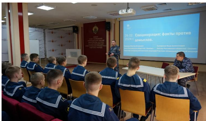
Рисунок 4. Тематическая встреча «Спецоперация факты против домыслов» с лекторами Российского Общества «Знание»

Информационные стенды и презентации, подготовленные воспитанниками, также демонстрируются гостям – участникам СВО. И нахимовцы могут обсудить с гостями интересные их вопросы, убедиться в достоверности тех или иных событий, разобраться в фейках и манипуляциях. (Рисунок 4)