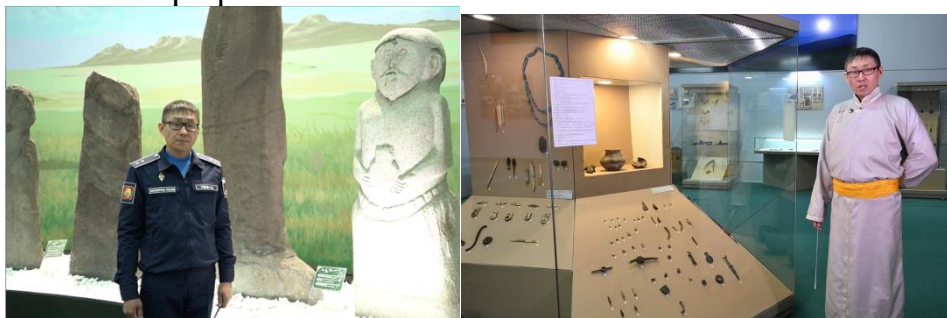
Фотографии 1, 2. Образовательный репортаж

Для создания репортажа подойдет самое простое оборудование: смартфон, штатив, петличный микрофон.