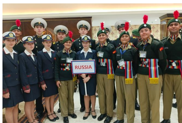
Рисунок 6. Делегация от Санкт-Петербургского Пансиона воспитанниц принимает участие в праздничных мероприятиях, посвященных Дню Республики Индии