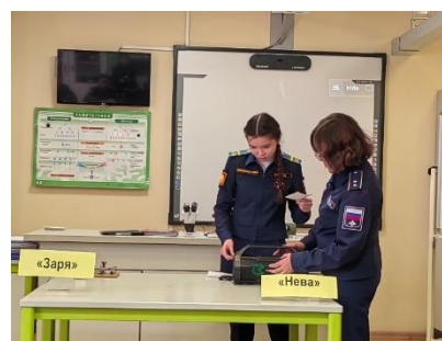
Фото 3,4. Классный час: «Военно-учетные специальности для женщин»