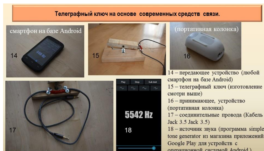
Фото 6. Проект «Телеграфный ключ на основе современных средств связи»

современных образовательных стандартов и профессиональным квалификациям педагога. Иными словами, специалист, который организывает профессиональные пробы должен быть квалифицирован по выбранной теме данного практического мероприятия.