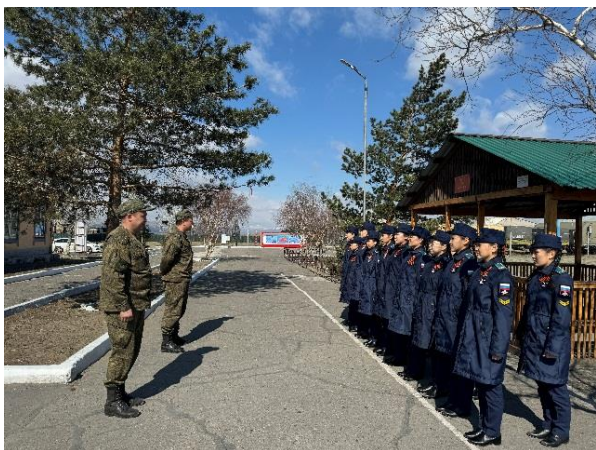
Фото 1 Экскурсия в воинскую часть по ПВО

Другим из эффективных видов профессиональных проб, который позволяет кадетам получить практический опыт в какой-либо профессиональной деятельности является - мастер класс. Приглашение разных специалистов на мастер-классы, которые имеют опыт работы в конкретной специальности, помогут расширить знания обучающихся о разных профессиях. Во время мастер-классов кадеты могут освоить простейшие профессиональные навыки, попробовать себя в роли специалиста и получить обратную связь от профессионала. Например, для одних, интересующихся медициной, можно организовать мастер-класс по оказанию первой медицинской помощи, а для кадет, интересующихся техникой, можно предложить придумать современный, усовершенствованный модель военной техники.