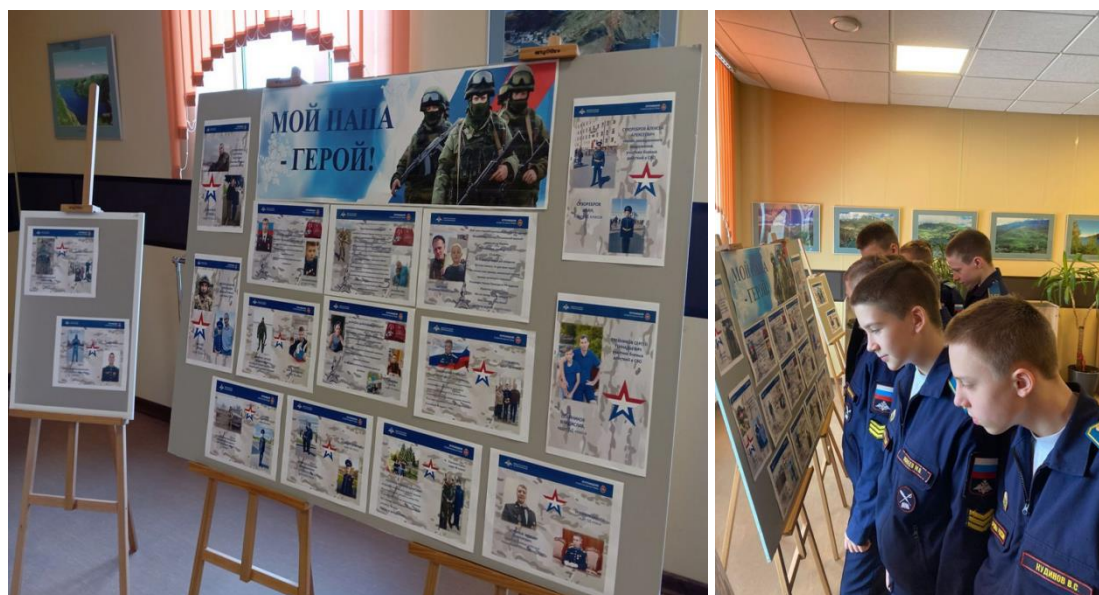
Рисунки 3,4. Выставка в рамках общеучилищного проекта «Мой папа – герой»

Наши кадеты знают каждого выпускника своего класса и гордятся ими.