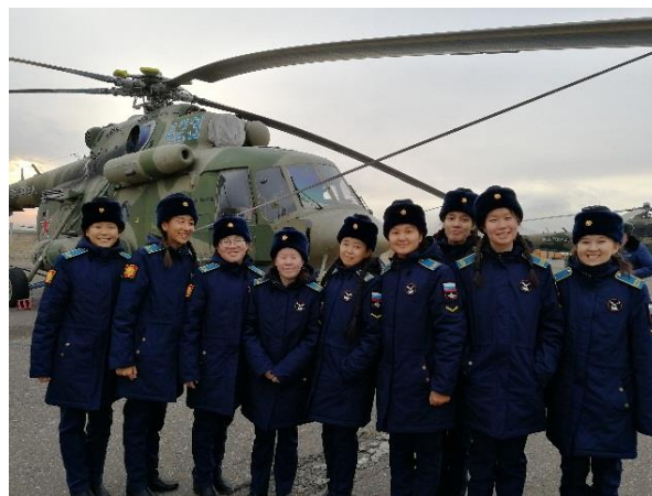
Фото2 Экскурсия в летную эскадрилью

Познавательным и результативным было мероприятие для воспитанников, стремящихся стать военными, классный час: «Военно-учетные специальности для женщин», где кадеты углубились в изучение военно-учетных специальностей (ВУС): узнали, что такое ВУС, его значение и структуру. Интересным моментом для девочек стало определение ВУС как кода, состоящего из шести цифр и одной буквы, который указывает на вид деятельности военнослужащего, что было наглядно показано на распечатанных страницах военного билета. Кадеты узнали, что ВУС помогает вести учет