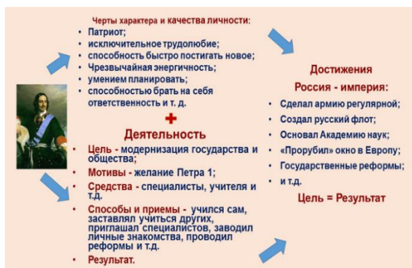
Результат работы по схеме при изучении личности Петра Первого