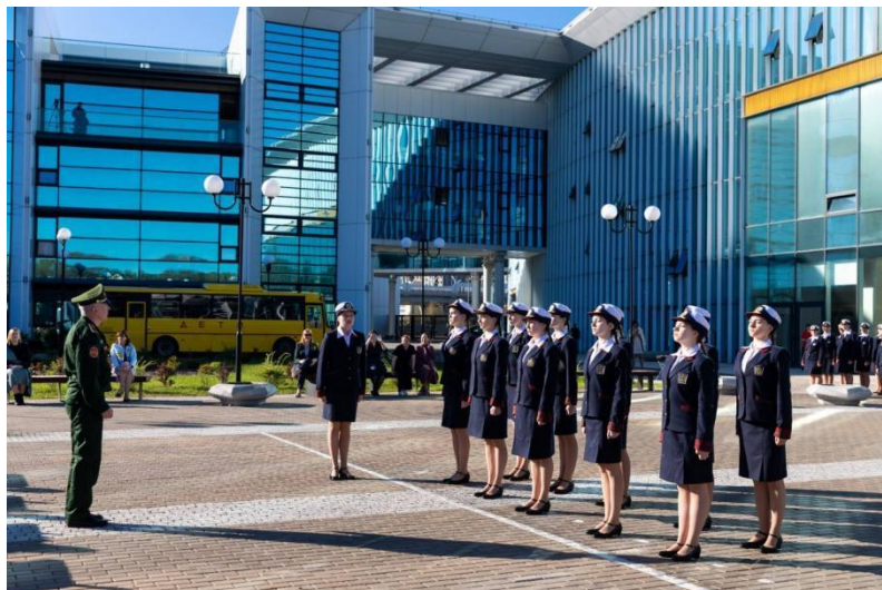
Рисунок 7. Воспитанницы 11 курса принимают участие в смотре строя и песни «Равнение на Победу», посвящённого Дню Победы в Великой Отечественной войне

Ключевая задача классного руководителя в работе с воспитанницами — выявление и развитие лидерских качеств. Это может быть реализовано через организацию такого мероприятия, как смотр песни и строя «Равнение на Победу». В рамках подготовки классный руководитель совместно с военными наставниками обучает воспитанниц навыкам строевой подготовки, командной работы, мотивирует девушек их к проявлению инициативы [рисунок 7].