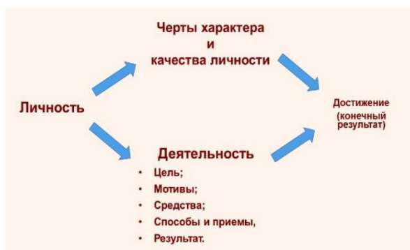
Схема для изучения исторических личностей