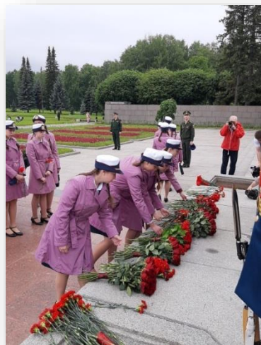
Рисунок 2. Воспитанницы Санкт-Петербургского Пансиона во время церемонии передачи частицы пламени Вечного огня от Пискаревского кладбища в Главный храм Вооружённых сил

Классный руководитель отвечает за планирование и реализацию данных мероприятий, координирует взаимодействие между воспитанницами и внешними организациями, что повышает эффективность воспитательной работы.