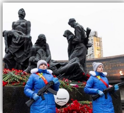
Рисунок 3. Воспитанницы Санкт-Петербургского Пансиона заступили на Вахту Памяти на Посту №1, приуроченную к 79-ой годовщине полного освобождения Ленинграда от фашистской блокады

Неотъемлемой частью кадетской культуры, в том числе и военной, является дисциплина. Плотный распорядок дня, обилие учебных и досуговых занятий обязывает воспитанницу быть собранной. Еще А.В. Суворов говорил: