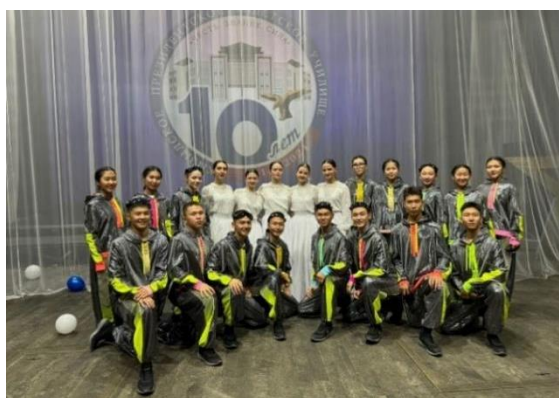
Рисунок 5. Воспитанницы Санкт-Петербургского Пансиона принимают участие во II Арт-фестивале «Вдохновение» (Кызылское президентское кадетское училище)

Воспитанницы с первых дней обучения погружаются в особую атмосферу города на Неве, его мультикультурное пространство. Учитывая широкую географию воспитанниц: от Калининграда до Владивостока и от Якутии до Крыма, девочки с первых дней пребывания в Пансионе учатся принятию другой культуры, уважению многообразия традиций народов нашей страны, а также других дружественных стран [рисунки 5,6]. Формированию культуры межнационального общения способствует изучение иностранных языков, раскрывающих историю, культуру стран изучаемого языка, традиции и обычаи народов этих стран [4, с. 34].